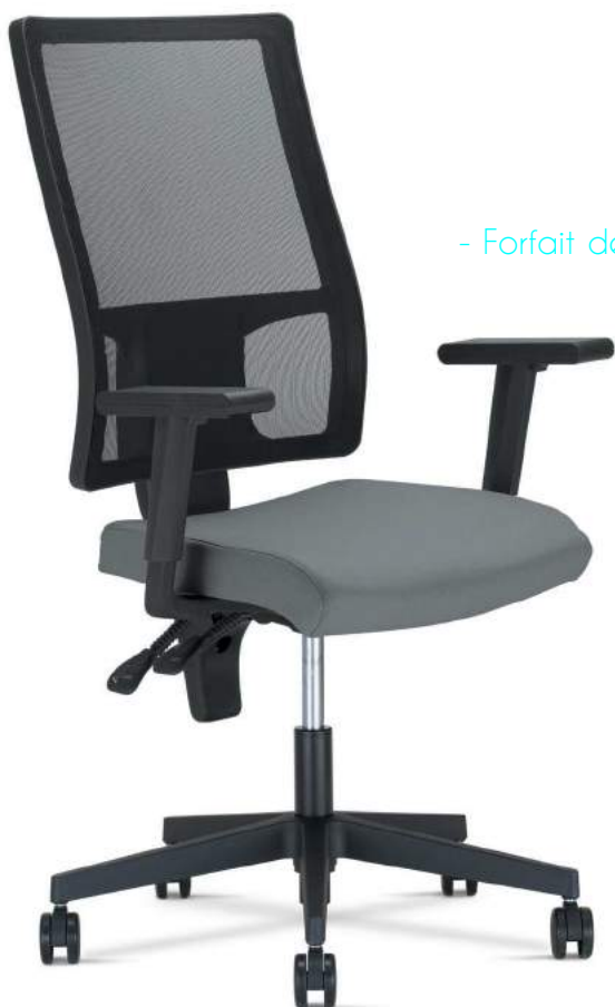
TAKTIK MESH ERGON 2L

- Forfait de port 30 € ht pour toute commande inférieurs à 1000 € ht