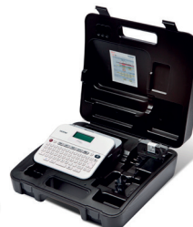
PT-D400VP PT-D400 + mallette de transport