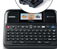
PT-D600VP PT-D600 + mallette de transport

Concentrez-vous sur votre business Brother s'occupe du reste