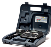
PT-D210VP PT-D210 + mallette de transport