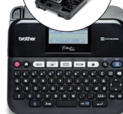
PT-D450VP PT-D450 + mallette de transport